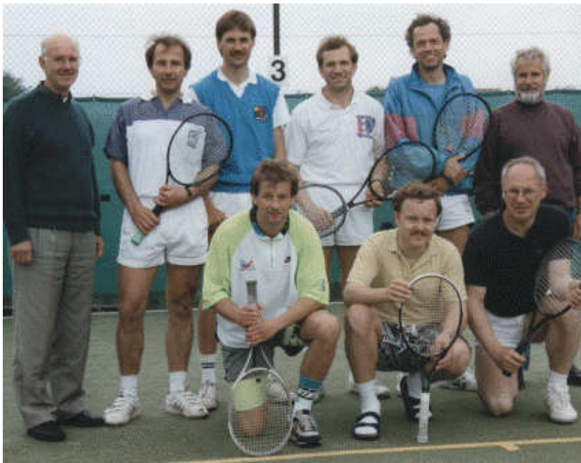
(Man beachte die Plätze: damals noch mit grünem Spielfeld.)